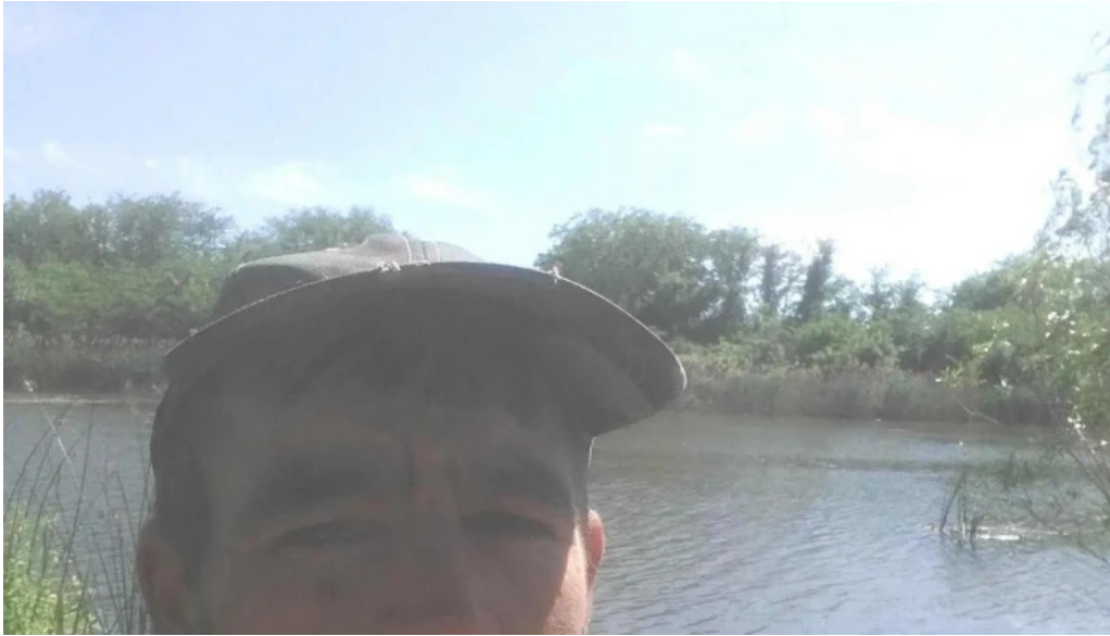
Lacul balta doamnei romania