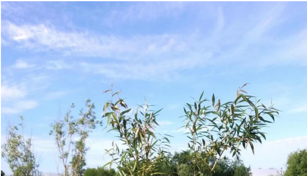
Lacul balta doamnei catalog