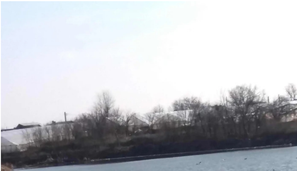
Lacul balta doamnei num?r