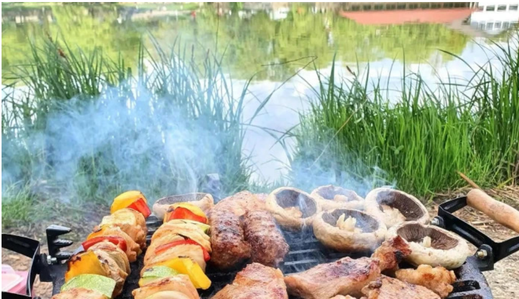
Lacul belciugatele instagram