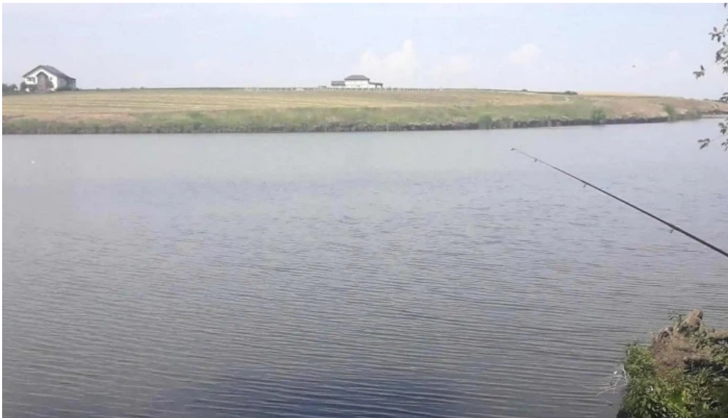
Lacul belciugatele comentarii