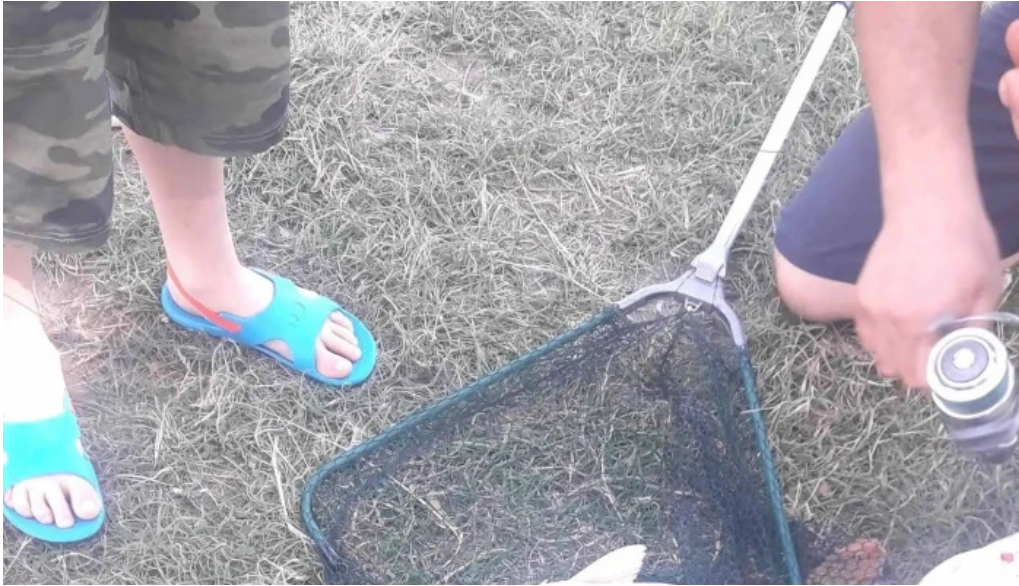
Lacul belciugatele romania