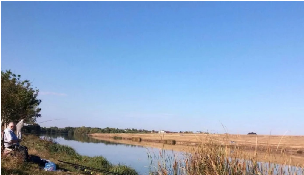
Lacul belciugatele fotografii