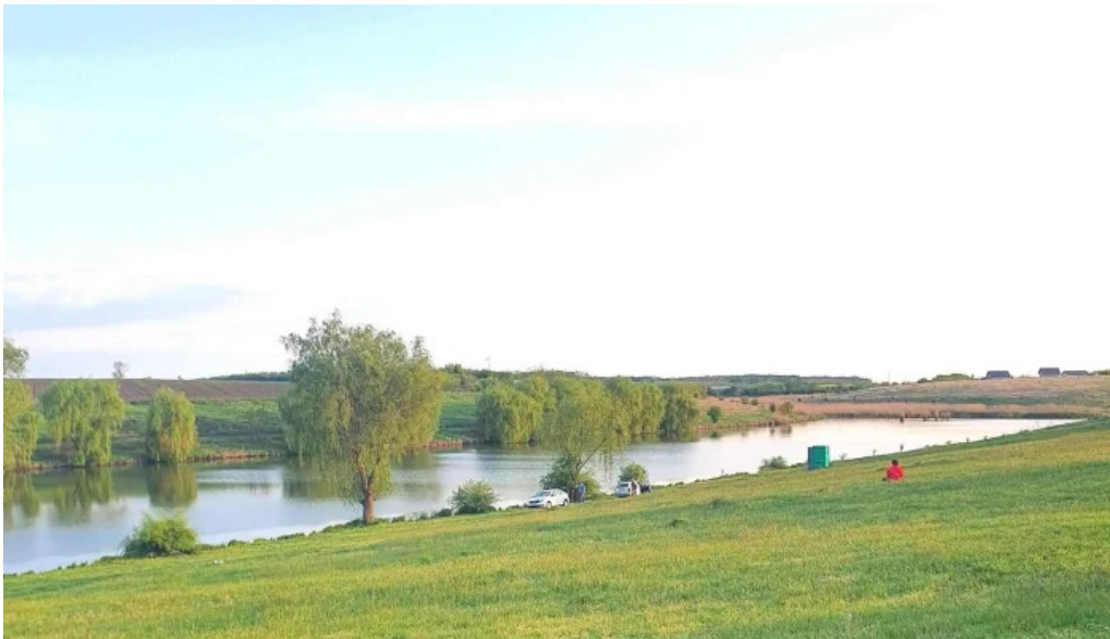
Lacul belciugatele promo?ie