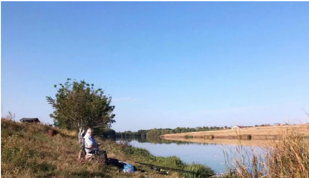
Lacul belciugatele site web