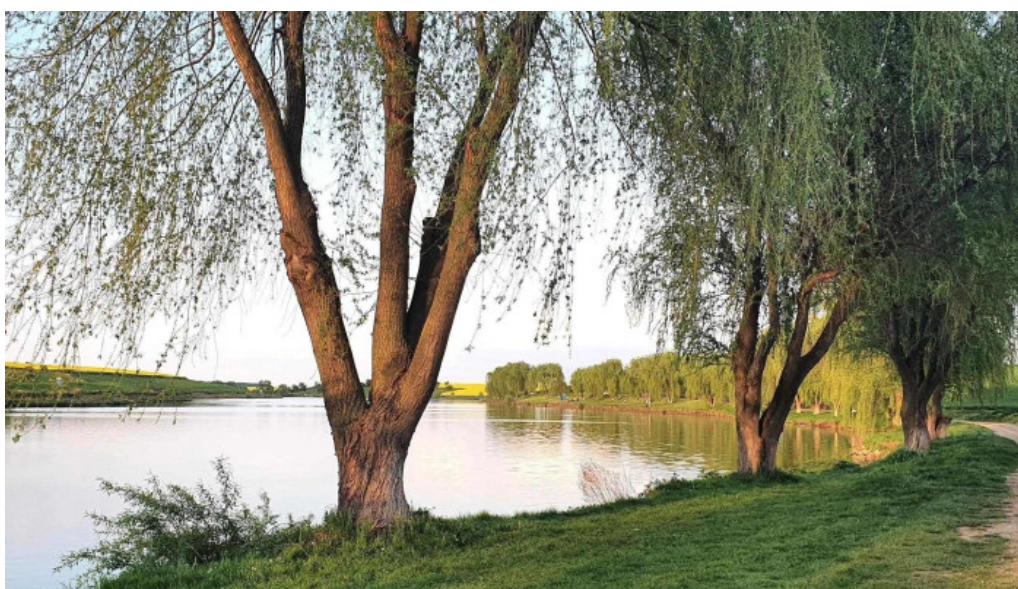
Lacul belciugatele aproape de mine