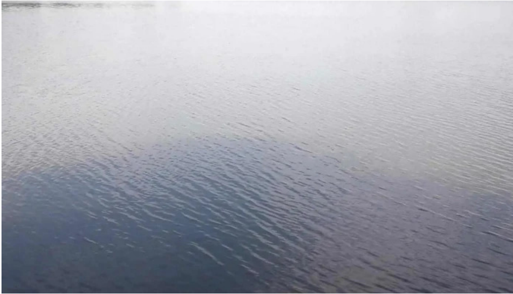
Lacul belciugatele program