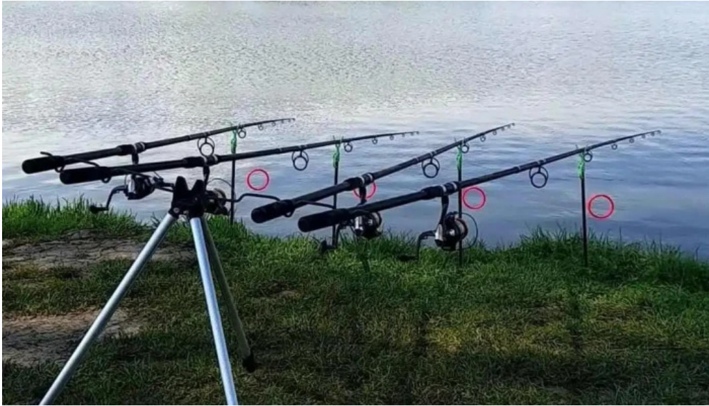
Lacul belciugatele videoclipuri