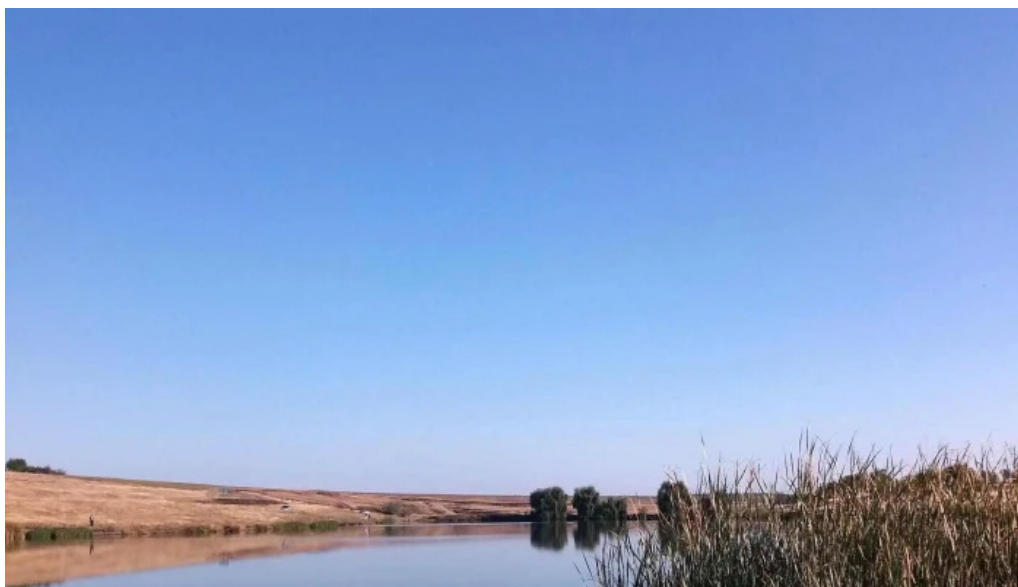
Lacul belciugatele catalog