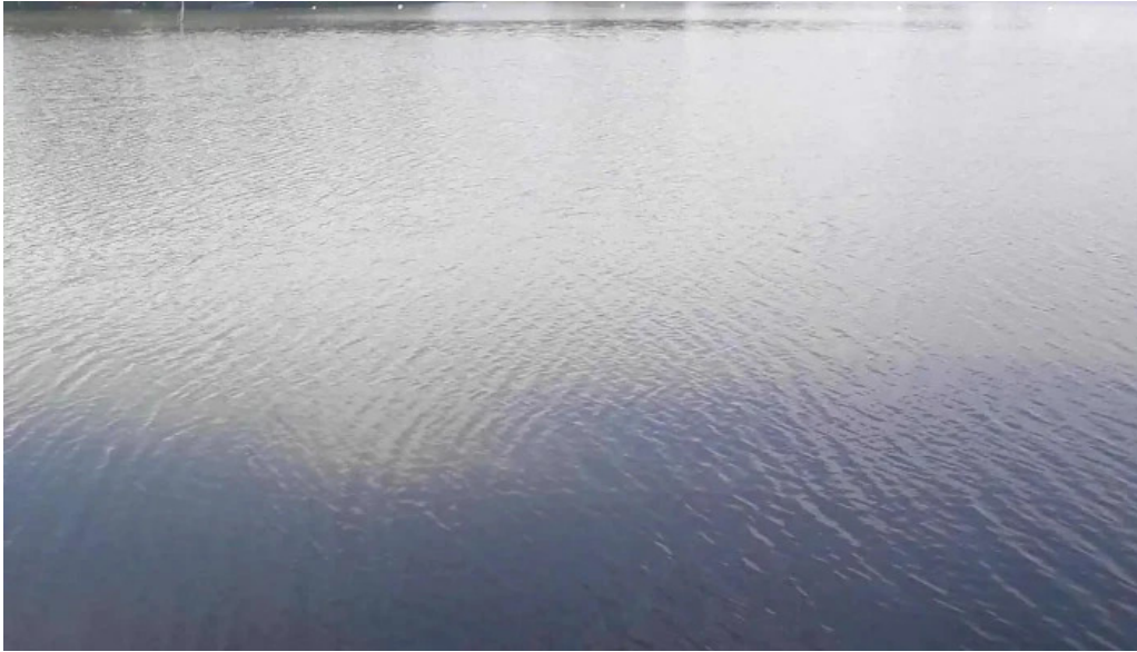
Lacul belciugatele cum s? ajungi acolo