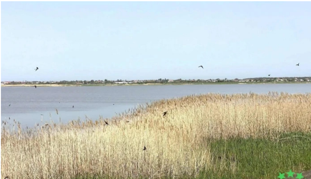
Lacul bistretu adres?