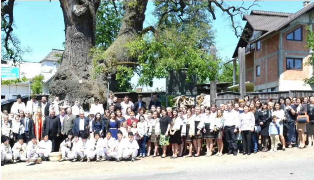
Stejarul multiseclar promo?ie