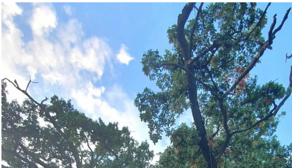
Stejarul multiseclar cajvana