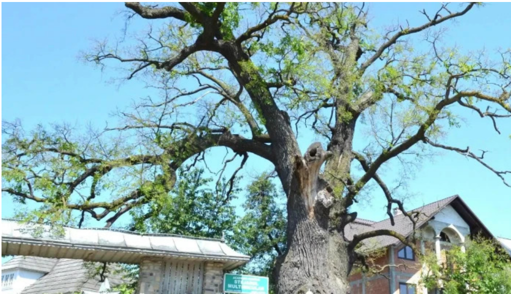
Stejarul multiseclar recenzii