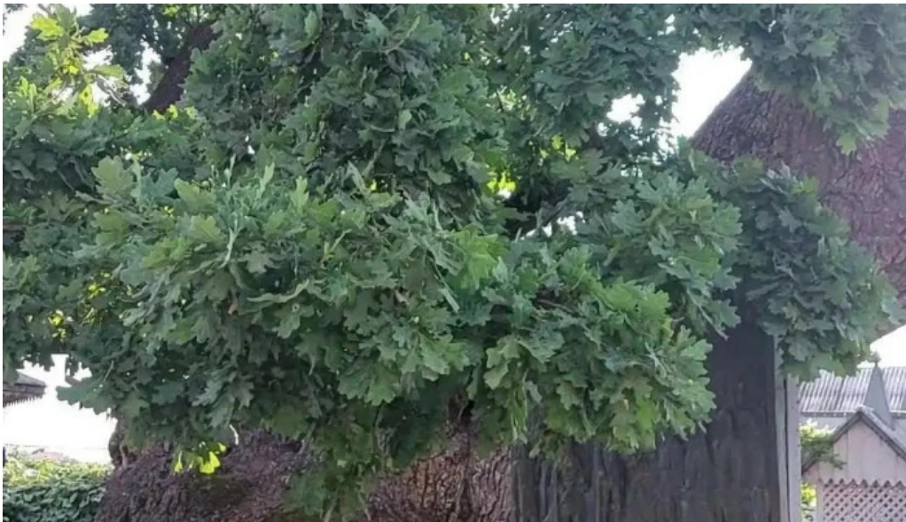
Stejarul multiseclar peisaj