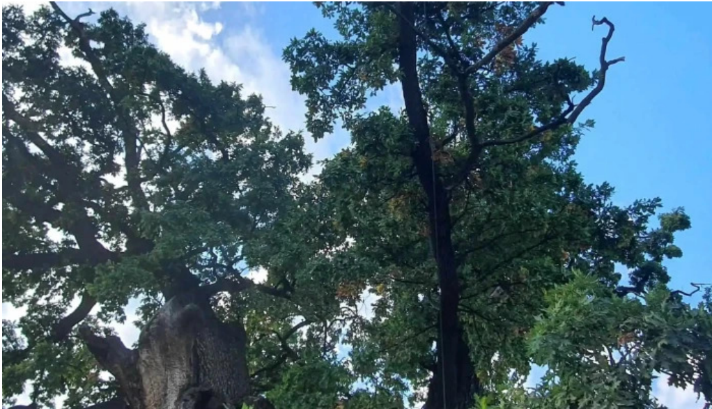
Stejarul multiseclar program