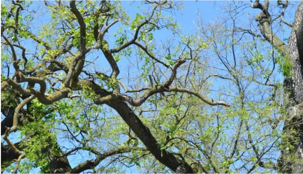
Stejarul multiseclar pre?uri