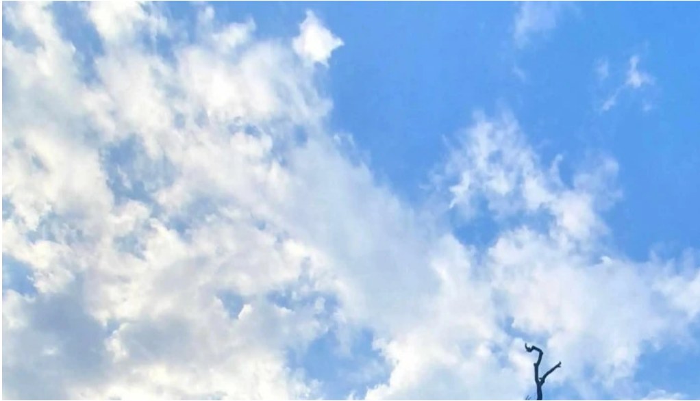
Stejarul multiseclar comentarii