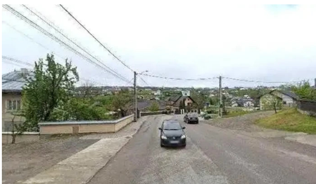
Stejarul multiseclar street view si 360deg