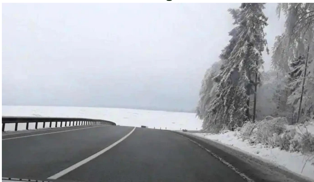
Stejarul multiseclar videoclipuri