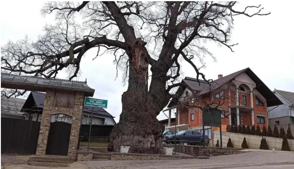
Stejarul multiseclar cele mai recente