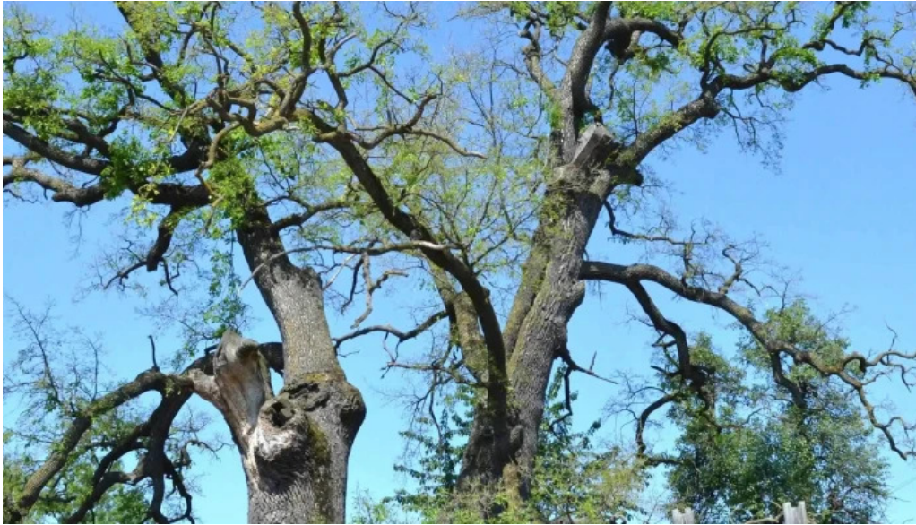
Stejarul multiseclar site web