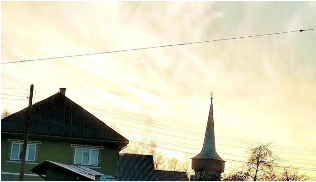
Abrud sat prețuri