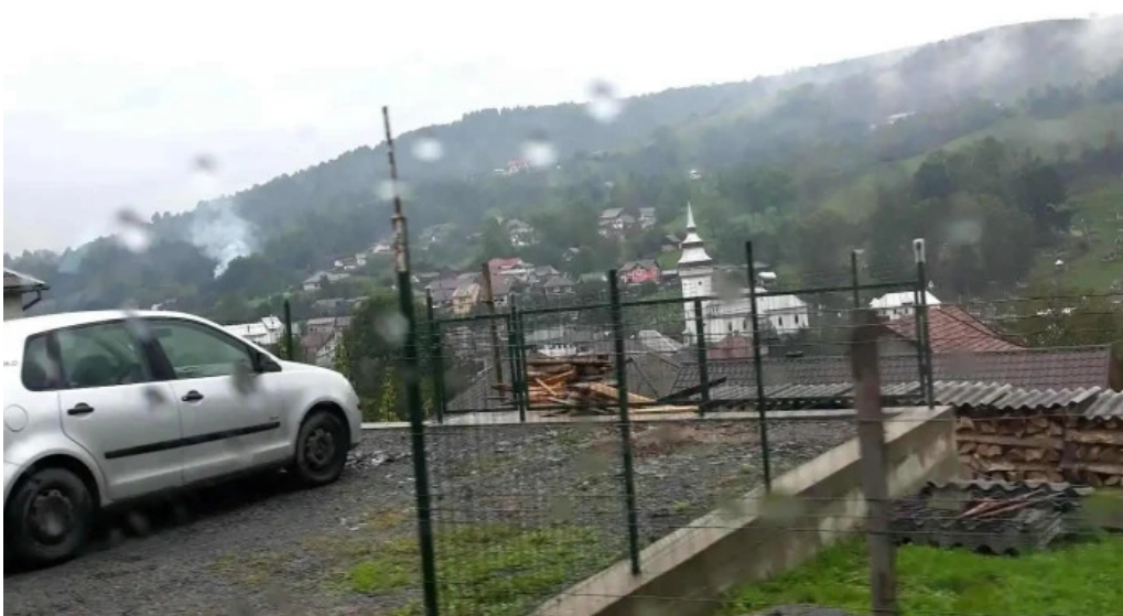
Abrud sat munte