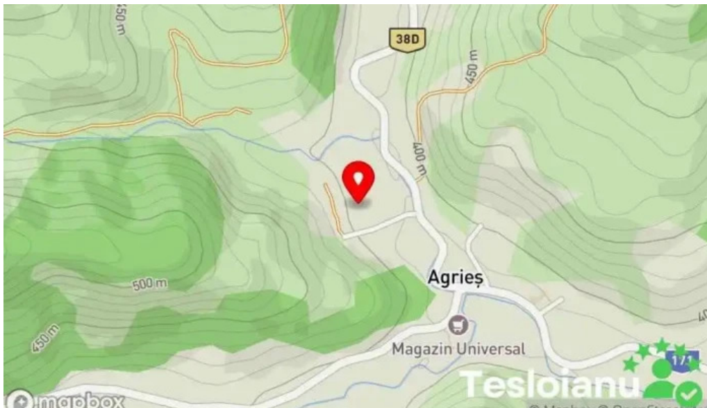
Agrieș lunca agrie?