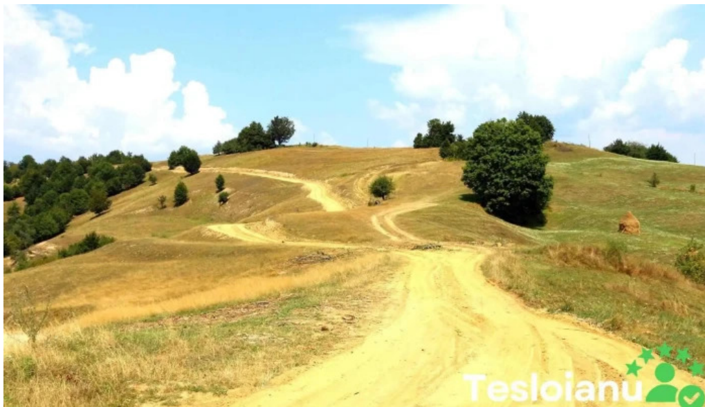
Agriesele deschise acum