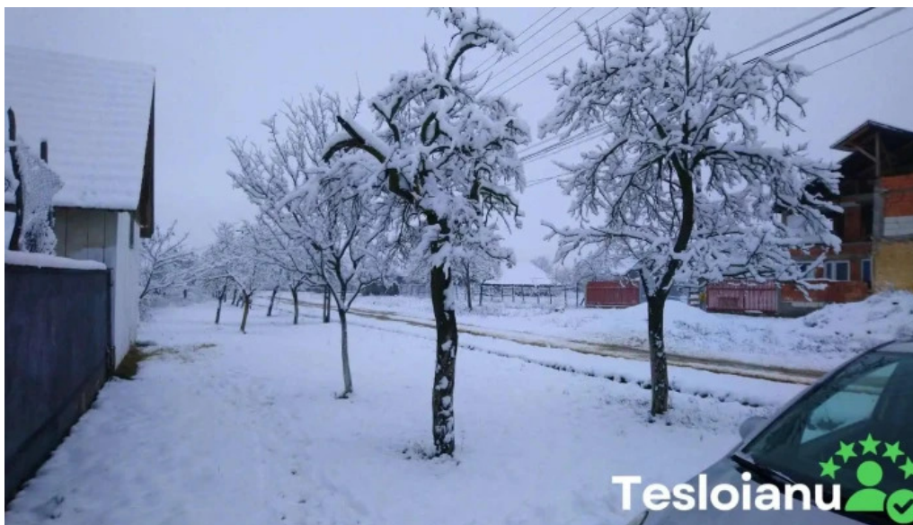
Agrișu mare videoclipuri