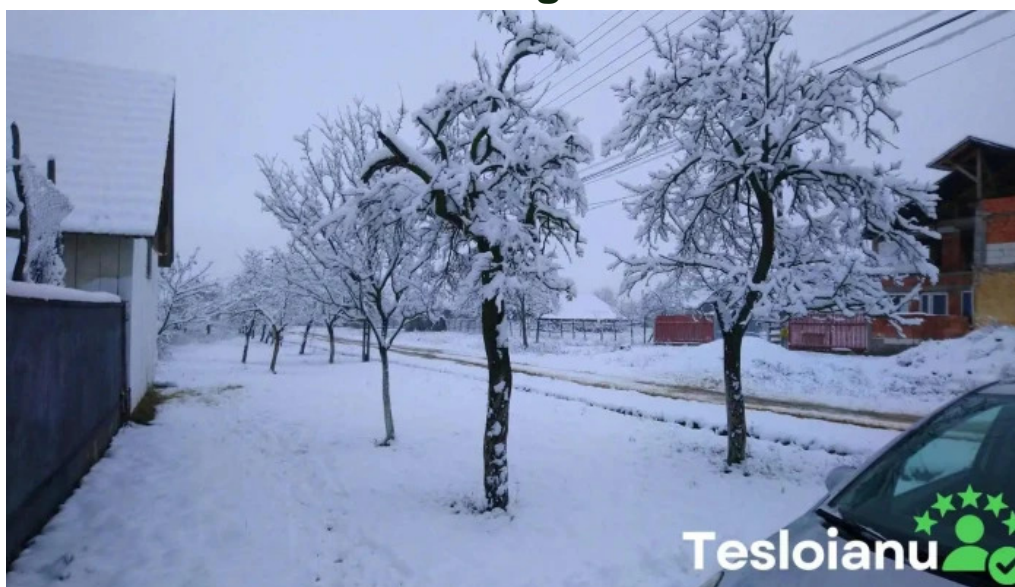
Agrișu mare agrișu mare