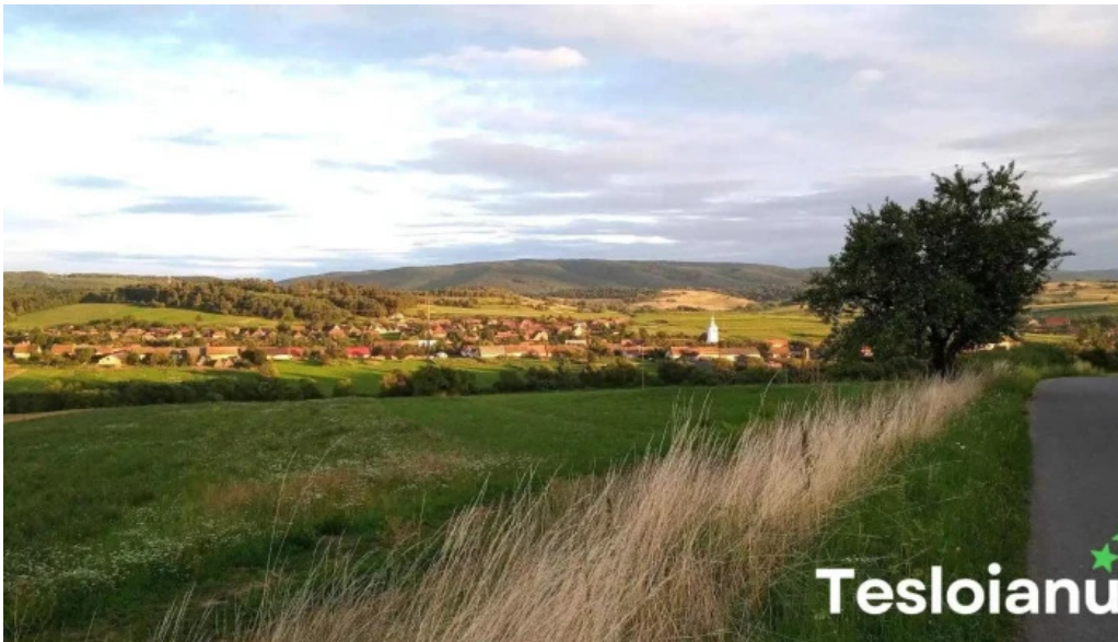
Aita seaca telefon