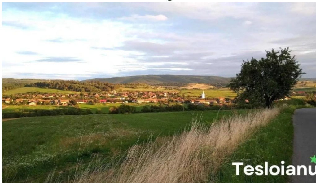
Aita seac? aita seac?