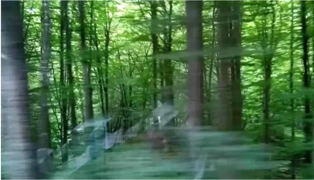
Aita seaca videoclipuri