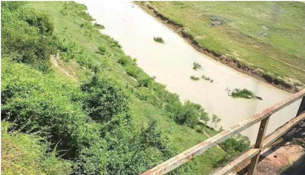
Albești muru albești muru