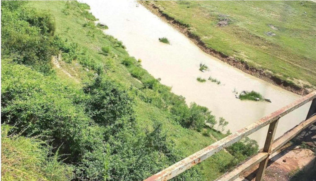
Albesti muru loca?ie