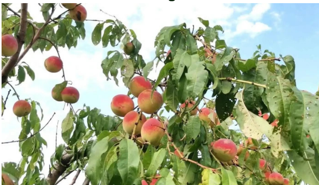
Alexandru odobescu site web