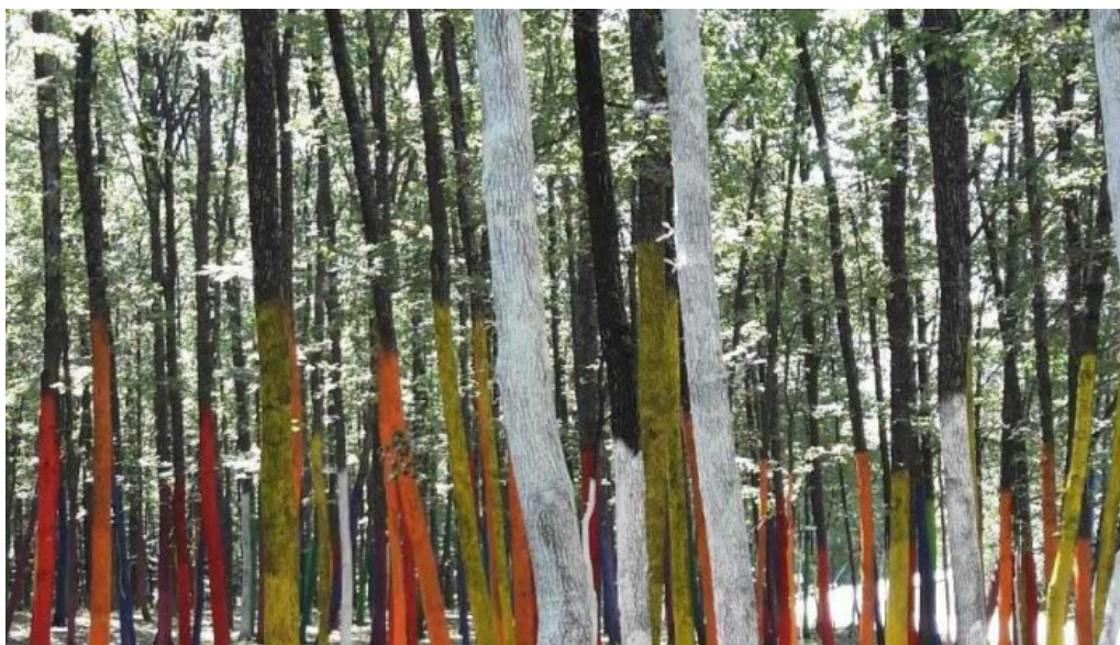
Alimpesti site web