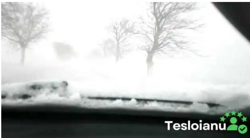
Amzacea cum s? ajungi acolo