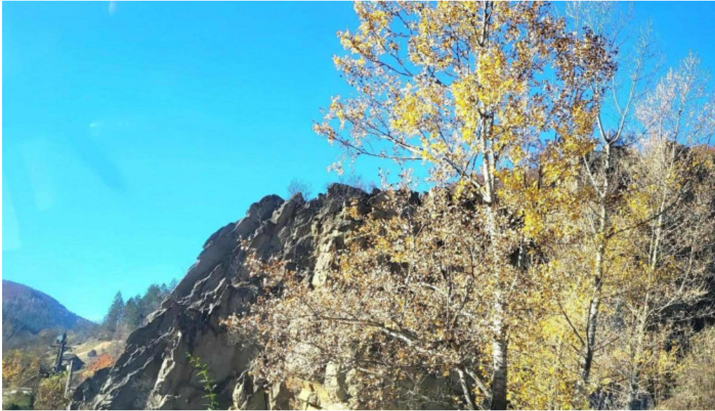
Andreiasu de jos munte