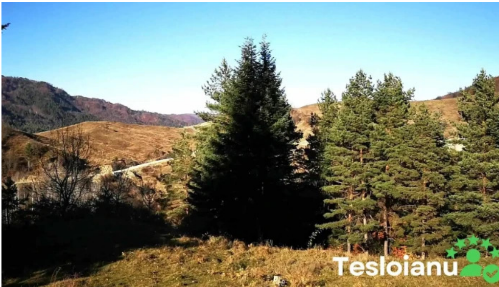
Andreiasu de jos videoclipuri