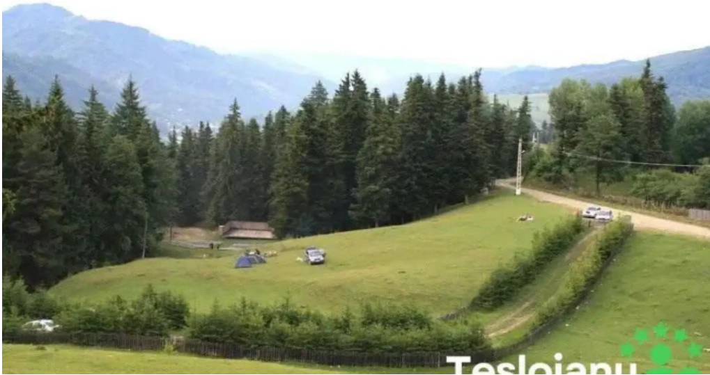
Andreiasu de jos zon?