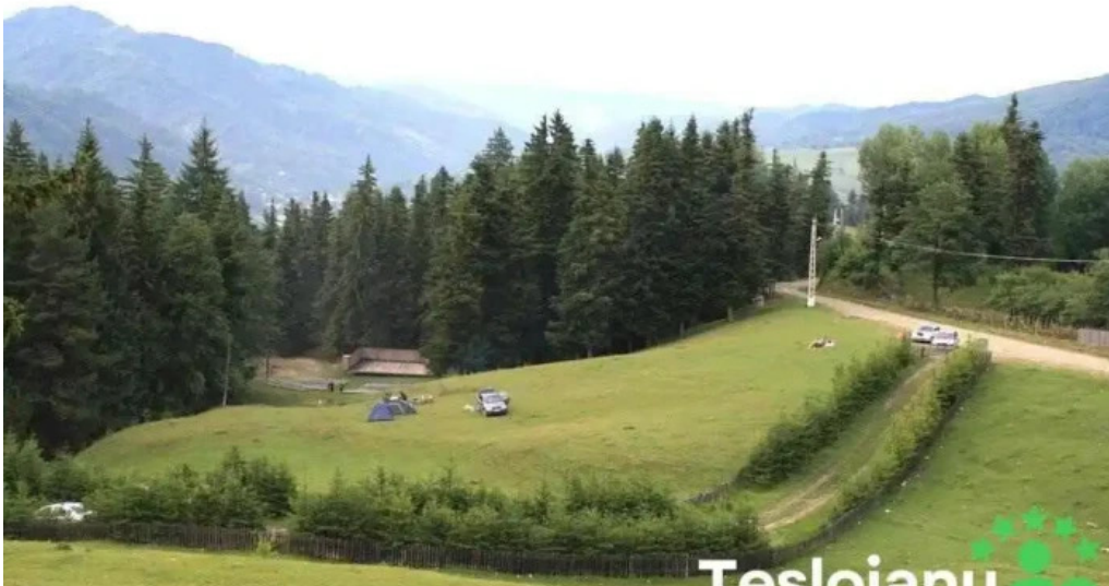
Andreia?u de jos andreia?u de jos