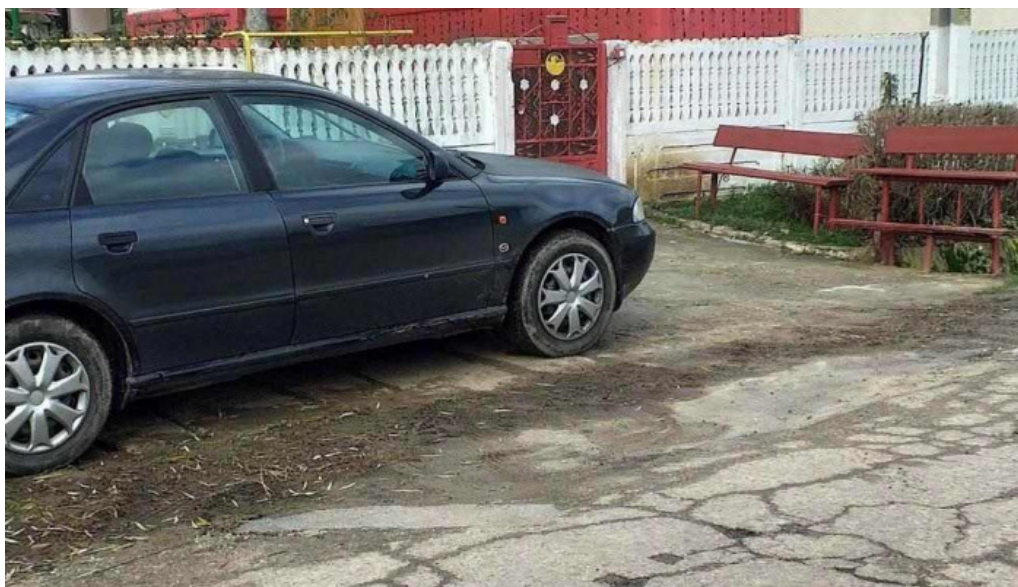
Aninoasa aproape de mine