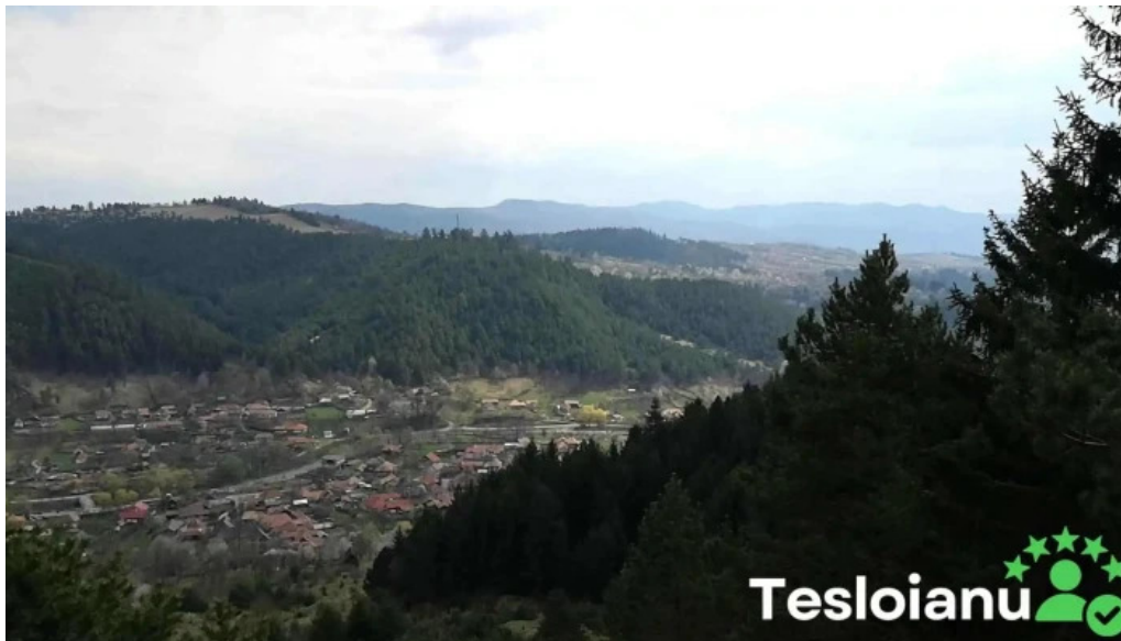
Apa as?u apa as?u