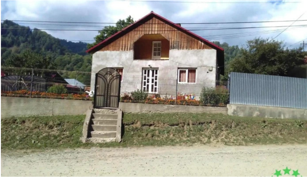
Apa asau munte