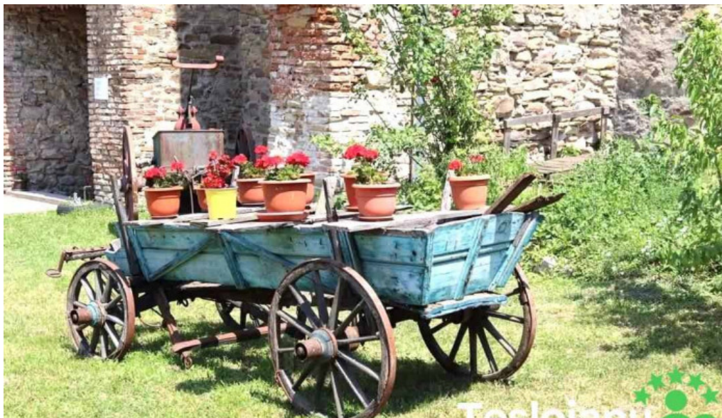
Axente sever axente sever