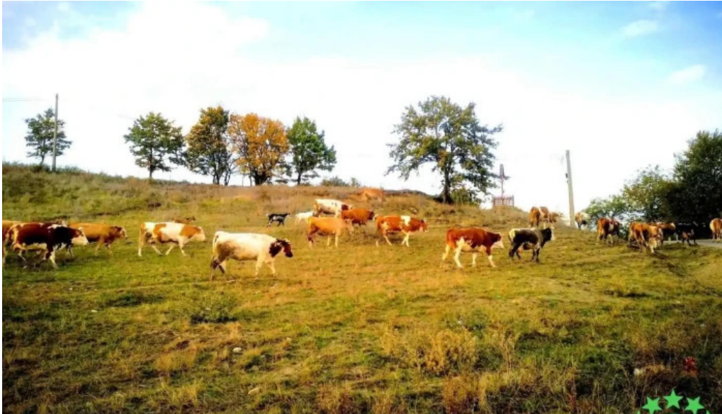
Babta aproape de mine