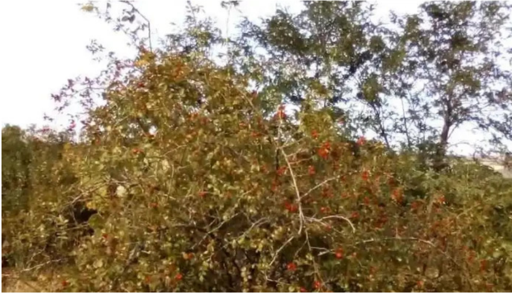
Bere?ti meria bere?ti meria