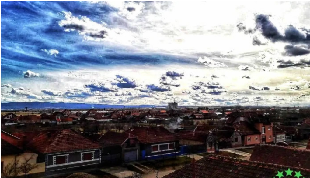
Berzovia cum s? ajungi acolo