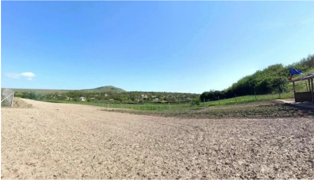
Bestepe street view si 360