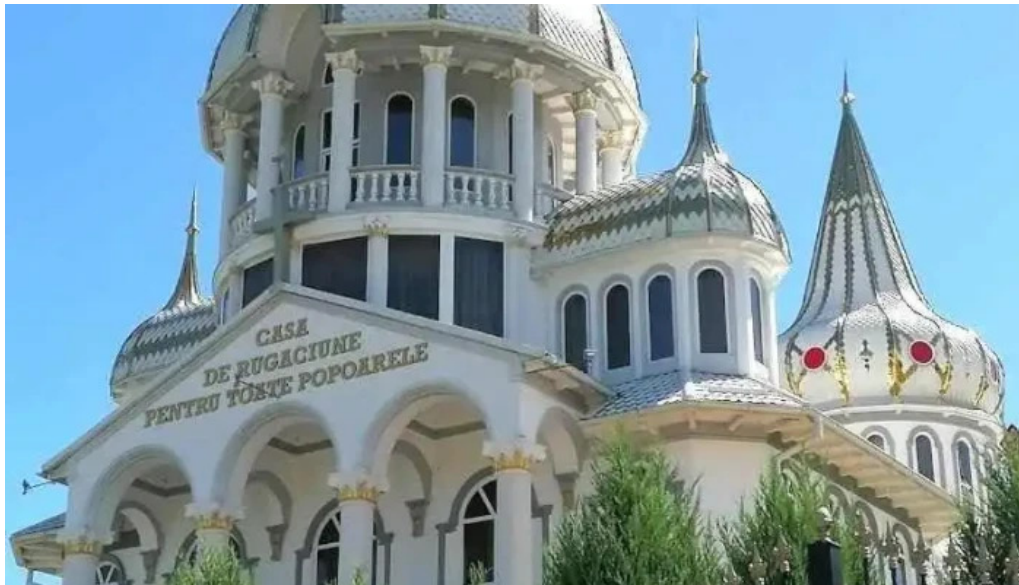
Breaza de sus breaza de sus