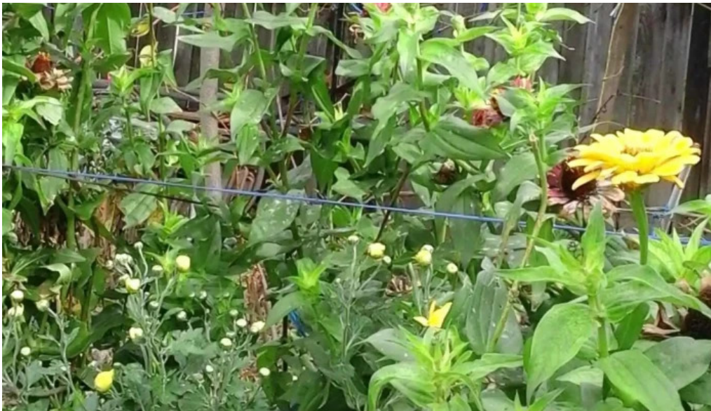
Bucovăț deschis acum