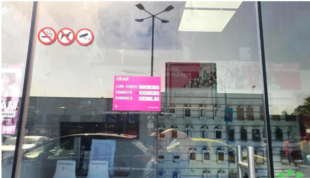
Copiere chei kaufland obor reduceri