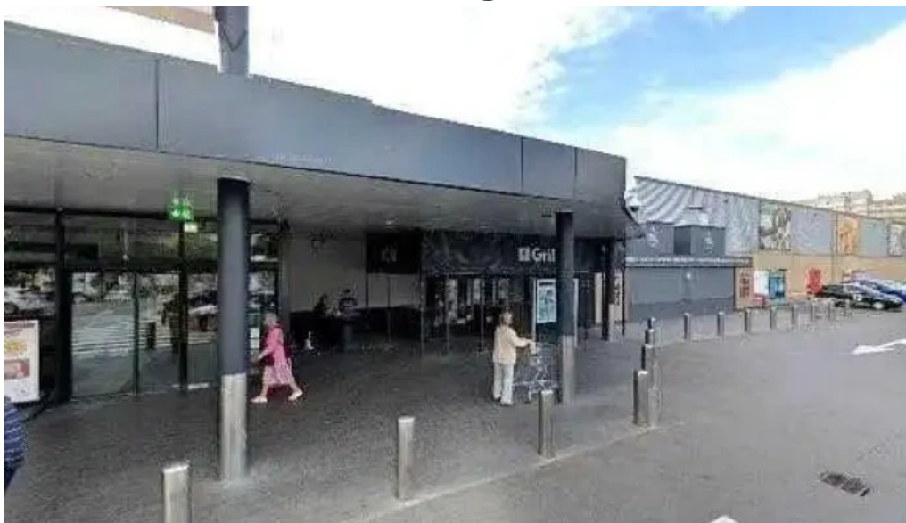
Copiere chei kaufland obor street view si 360deg