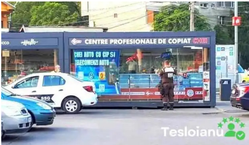
Copiere chei kaufland obor exterior