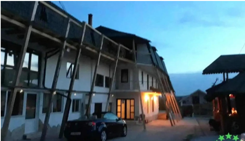
Budeasa mare budeasa mare