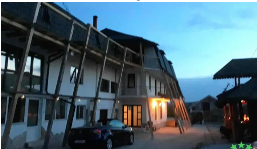
Budeasa mare locație