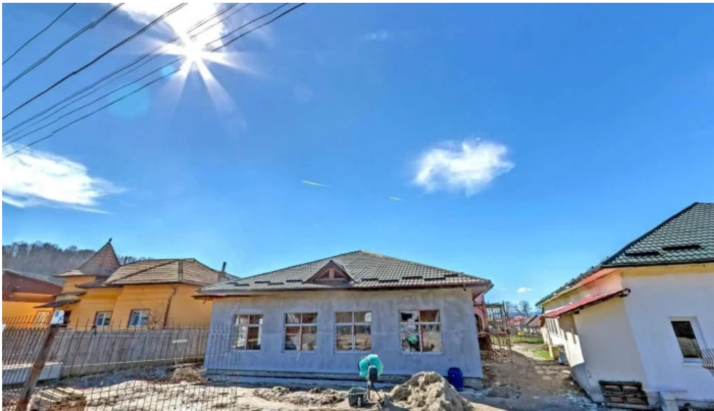
Budesti street view si 360deg