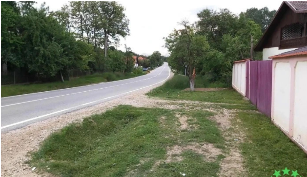
Bumbesti pitic loca?ie