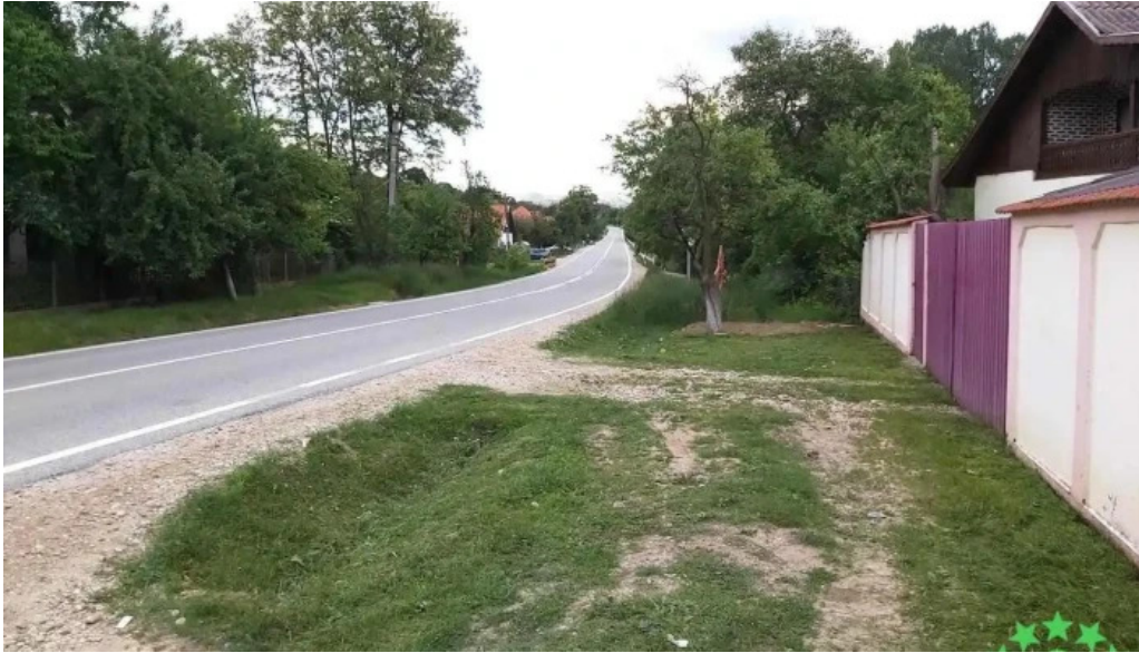
Bumbe?ti pi?ic bumbe?ti pi?ic