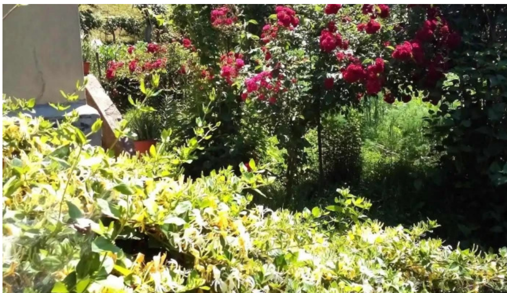
Barasti site web