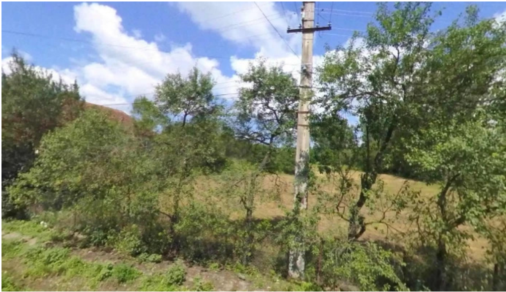
Basesti street view si 360deg