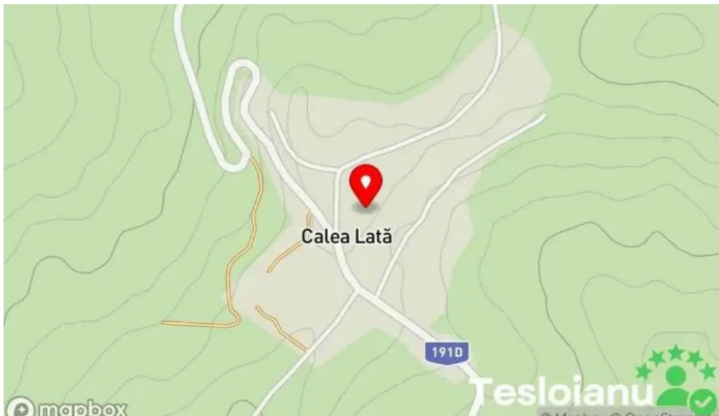
Calea lata hart?