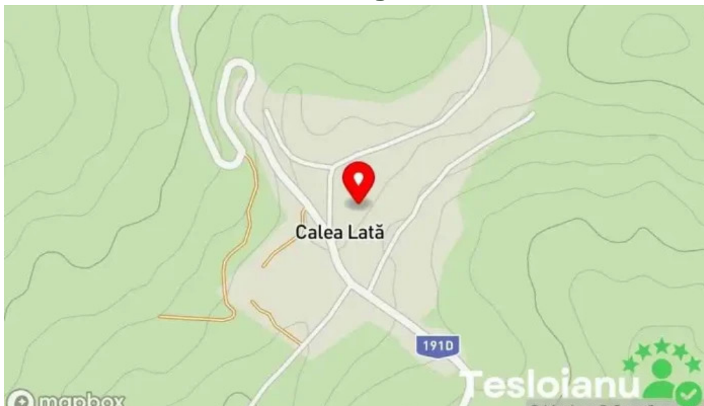
Calea lată calea lată