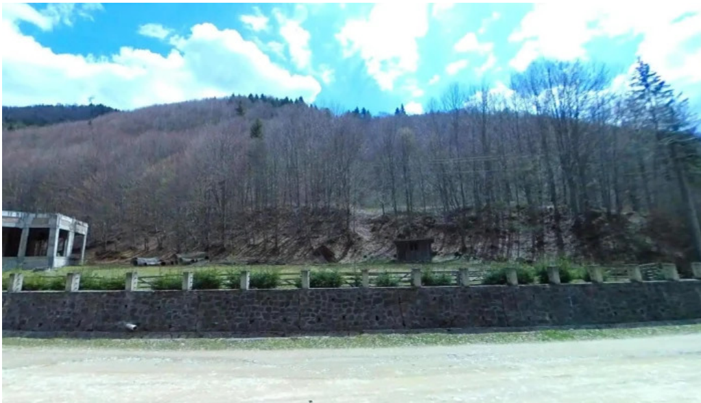
Casoca street view si 360deg