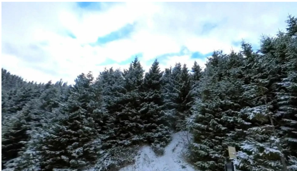
Ceahlau street view si 360deg