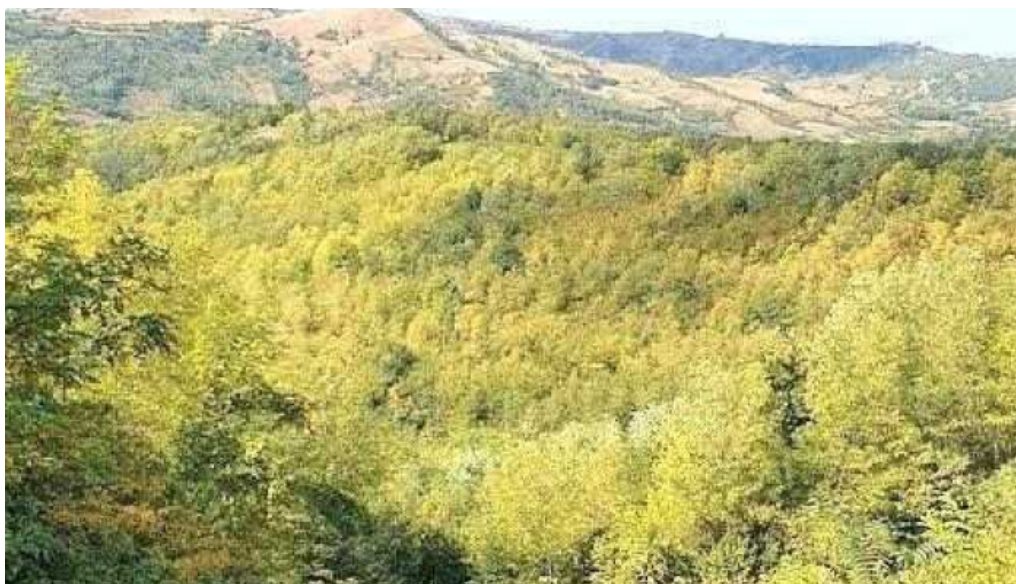
Ceptura de sus ceptura de sus