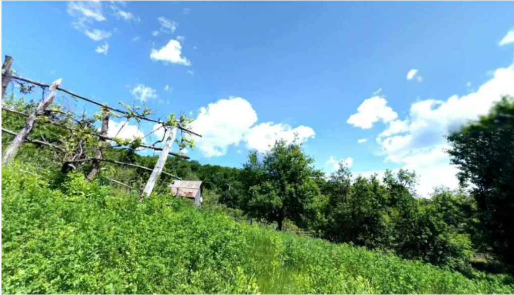
Cernisoara street view si 360deg