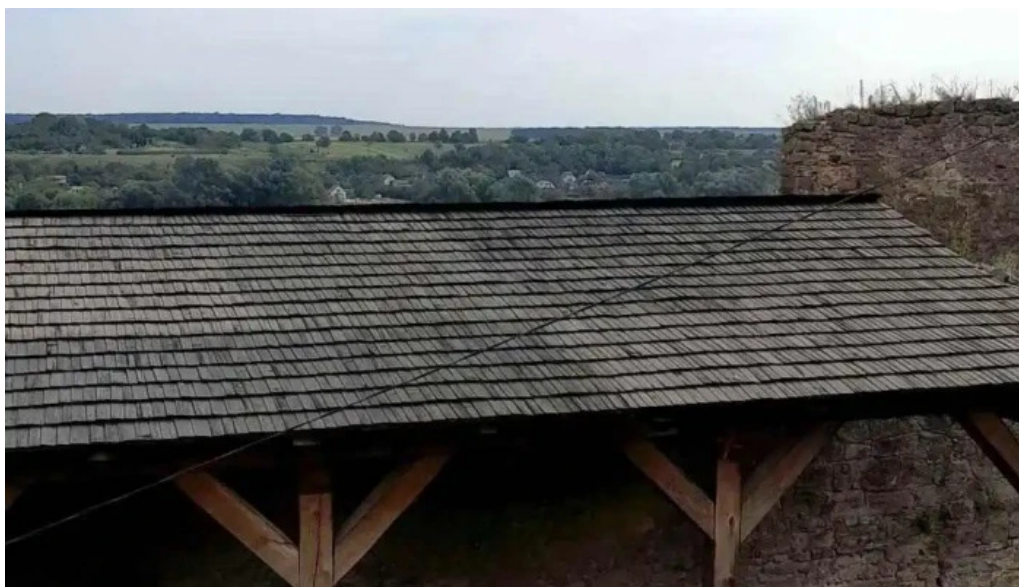
Cetatea de balta videoclipuri