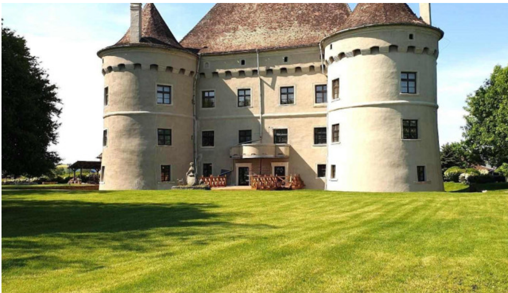
Cetatea de balta zon?