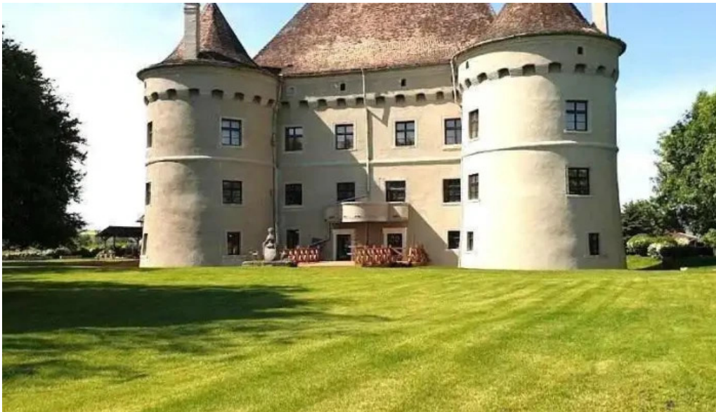
Cetatea de balt? cetatea de balt?