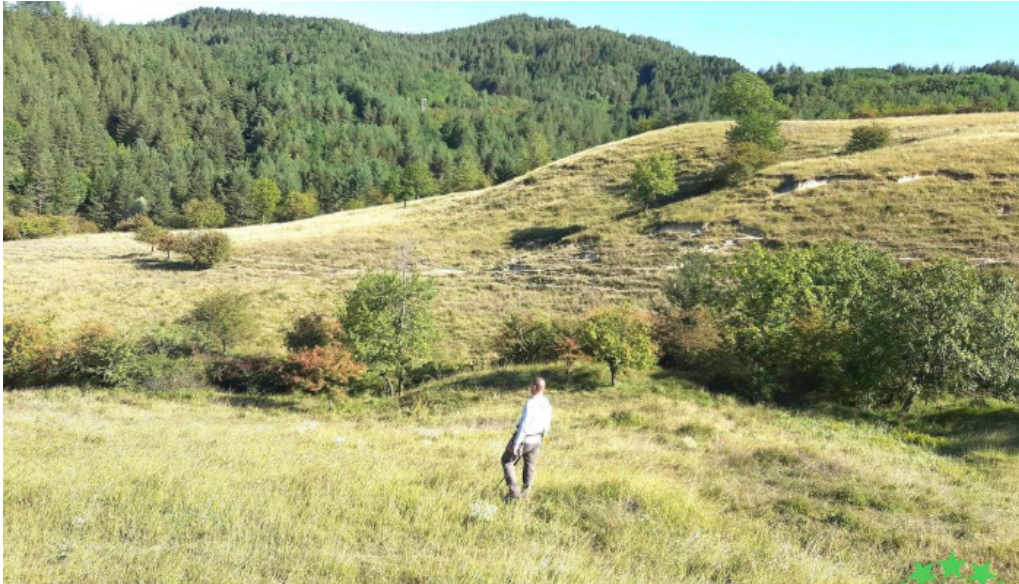
Chiliile deschis acum