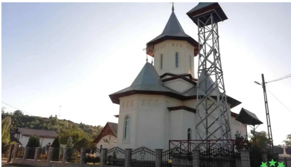
Chintinici aproape de mine