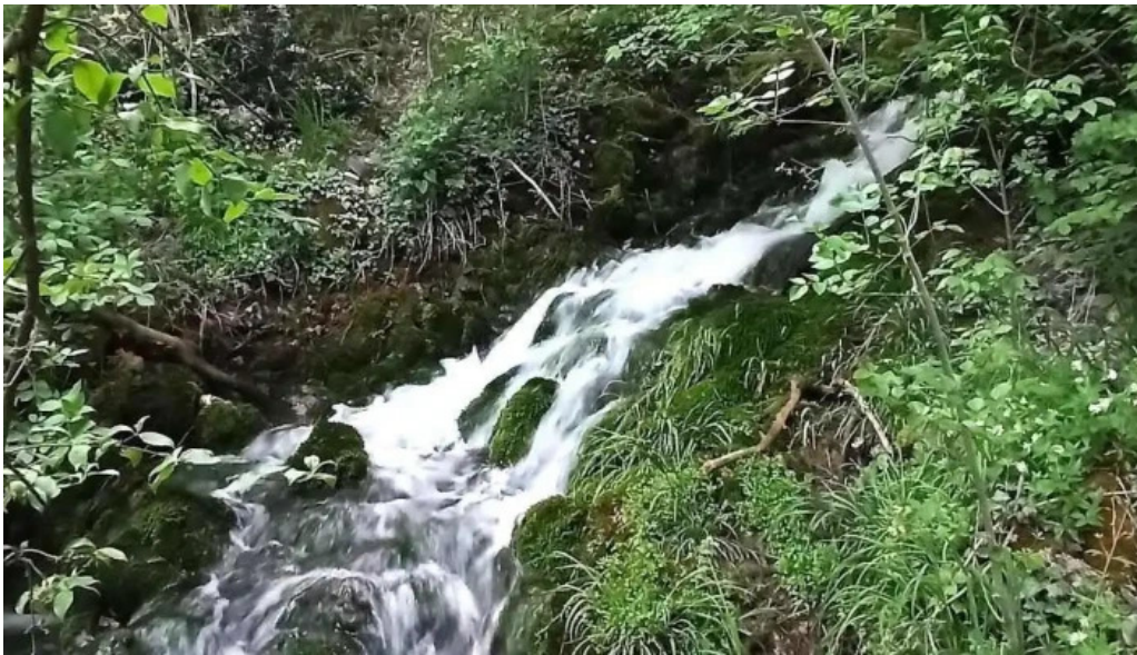
Ciclova romana promo?ie