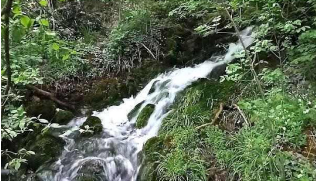
Ciclova roman? ciclova roman?