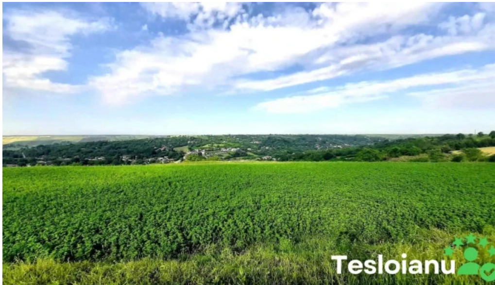
Cleanov deschis acum