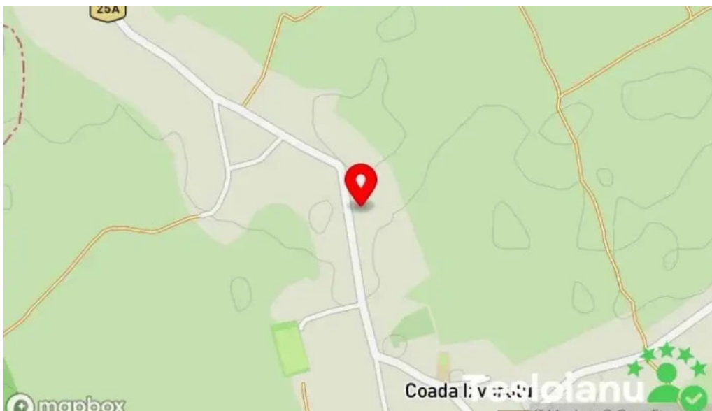
Coadă izvorului coada izvorului