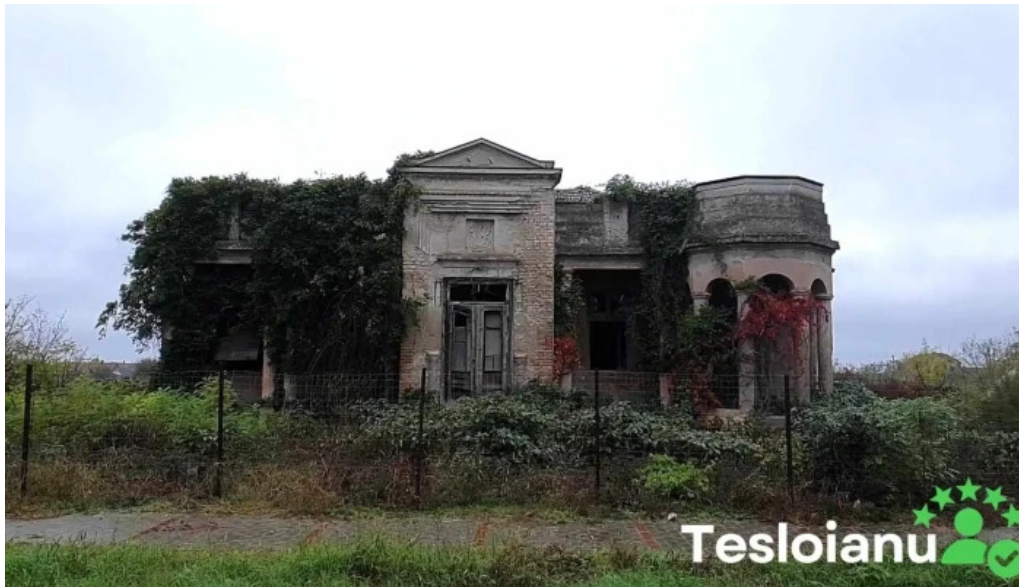
Comlo?u mare comlo?u mare