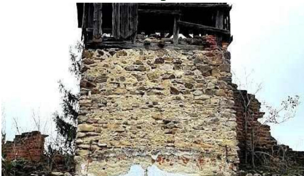
Comuna bretea roman? comuna bretea roman?