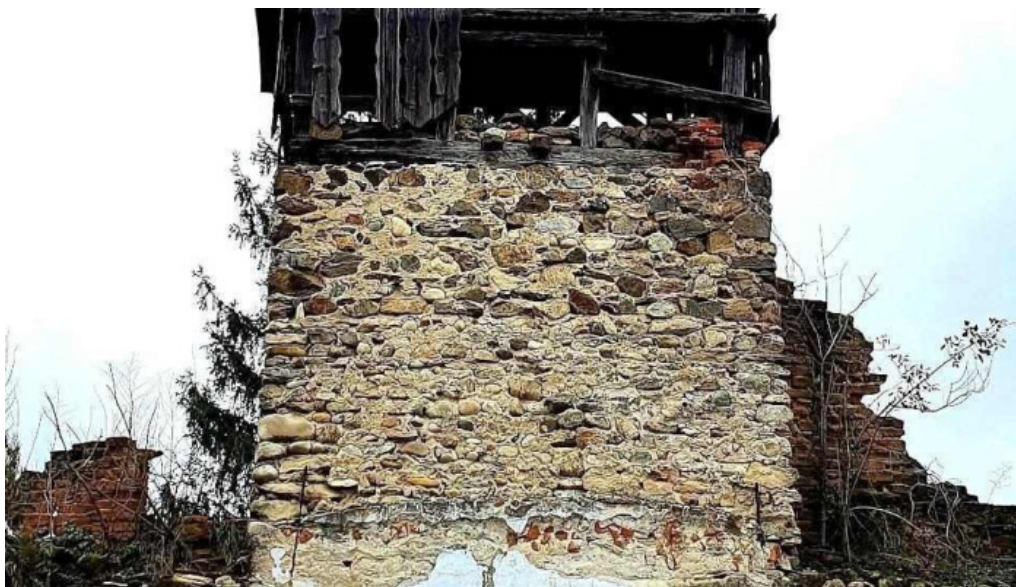
Comuna bretea romana aproape de mine