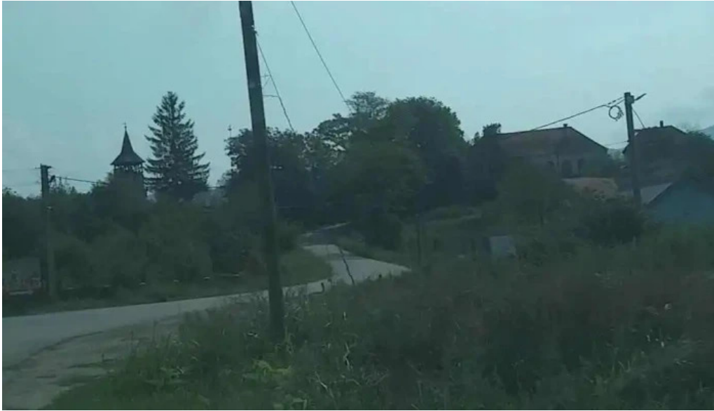
Comuna bretea romana videoclipuri