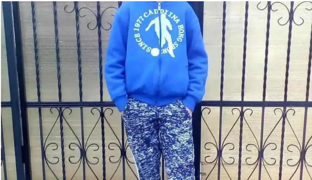
Comuna buzoe?ti comuna buzoe?ti