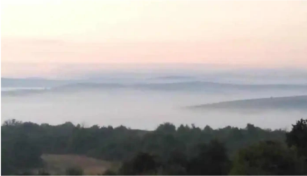
Comuna chie?d comuna chie?d