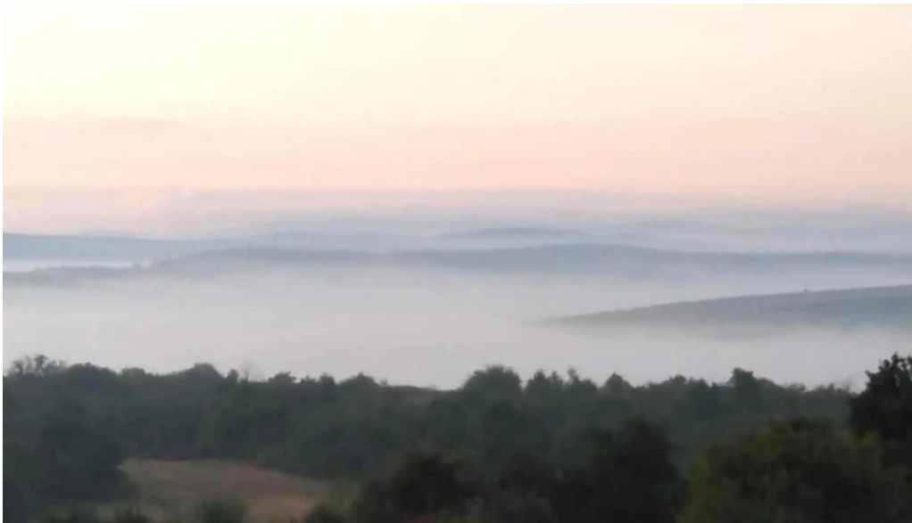
Comuna chiesd telefon