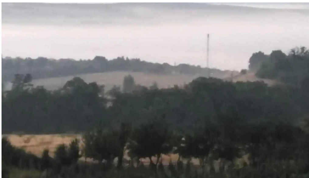
Comuna chiesd munte