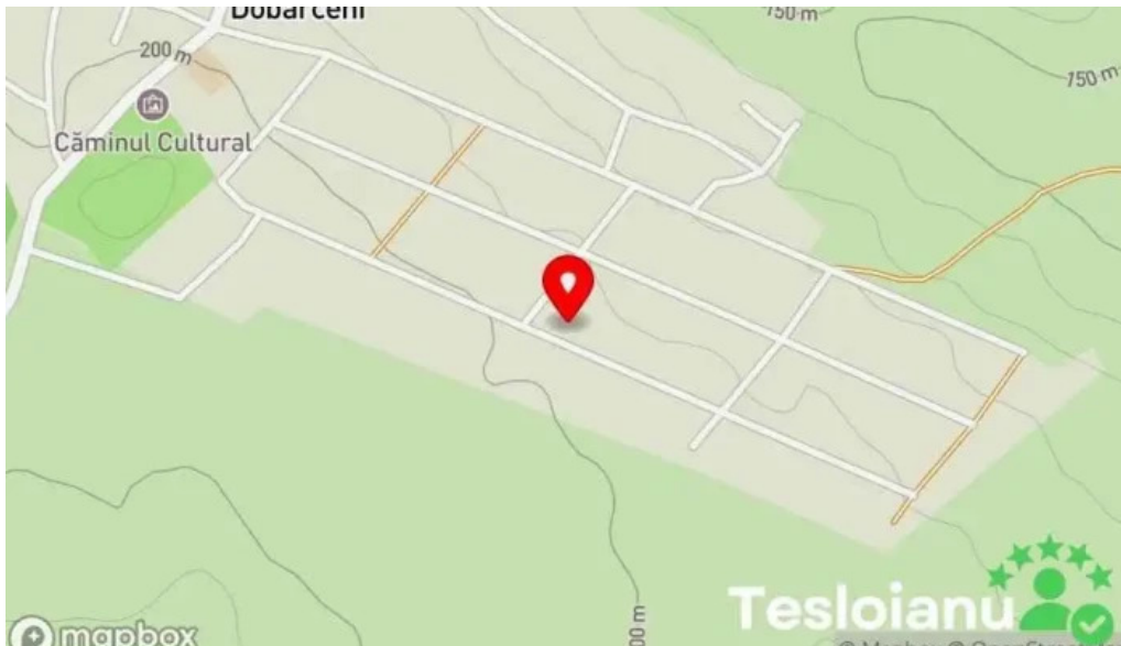
Comuna dobarțeni comuna dobarțeni