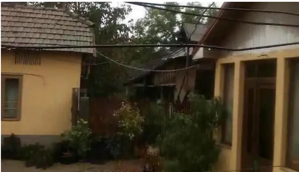
Comuna dobrote?ti comuna dobrote?ti