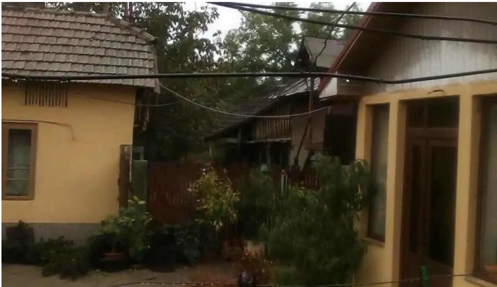
Comuna dobrotesti fotografii