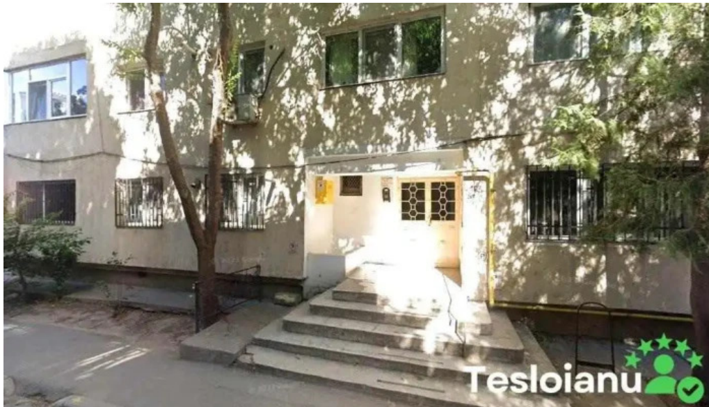
Deblocari apartamente si auto constanta total open constan?a