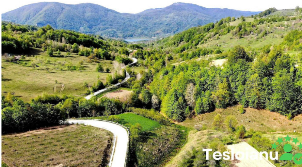
Cornereva site web