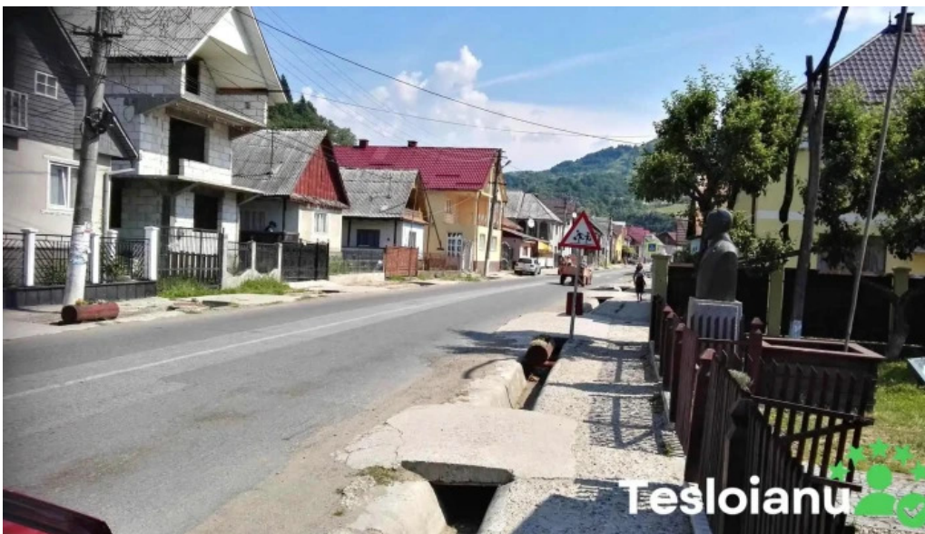
Cosbuc site web