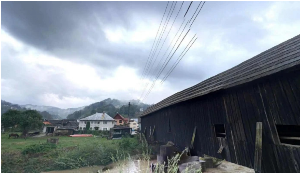
Cosbuc street view si 360deg