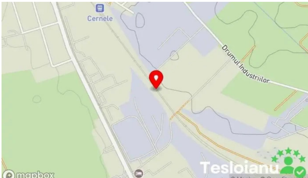
Cernele de sus hart?